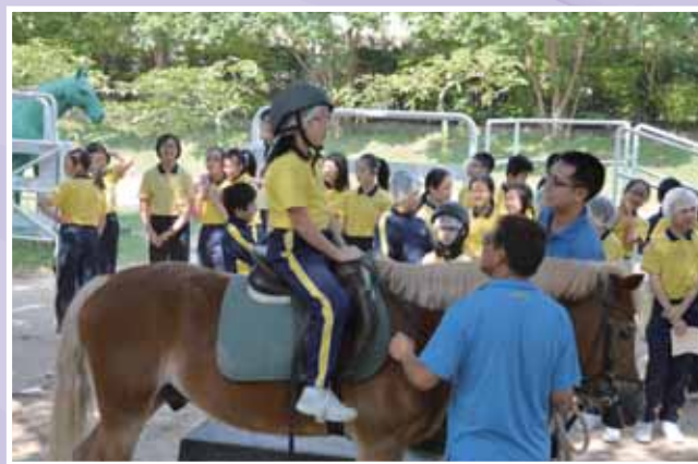
• 晴朗天，綠蔭樹下顯英姿！

此外，本校亦安排同學到屯門公眾騎術學校參觀。在導賞員帶領下，同學們認識到馬匹日常生活及馬房的運作模式。同學在綠蔭茂盛的樹下親身體驗了策騎的樂趣，令他們對活動留下了深刻回憶。