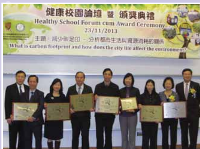
• 本校二度榮獲「香港健康學校獎勵計劃」金獎。

為發揮小班教學之效能，關顧不同學童的需要，我校優化「聰明教室」(Smart Classroom)，全面規劃課程，持續將「啟發潛能教育」理念融入課堂，適時運用電子工具，善用評估，並提供課後支援。樂校在重視中英文學習之餘，亦為學生提供多元化之課外活動，兼顧培育全人發展，實現「愉愉快快學習，健健康康成長」的願景！