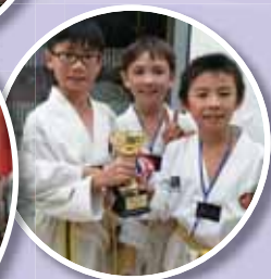
• 全港跆拳道套拳冠軍。