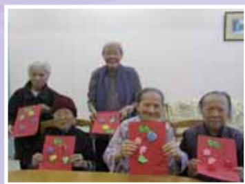
手工製作小組 (11/2013) 組員用心製作小手工，多麼開心！