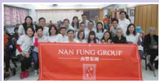
南豐集團義工團到訪 (14/12/2013) 義工與院友一起盡慶。