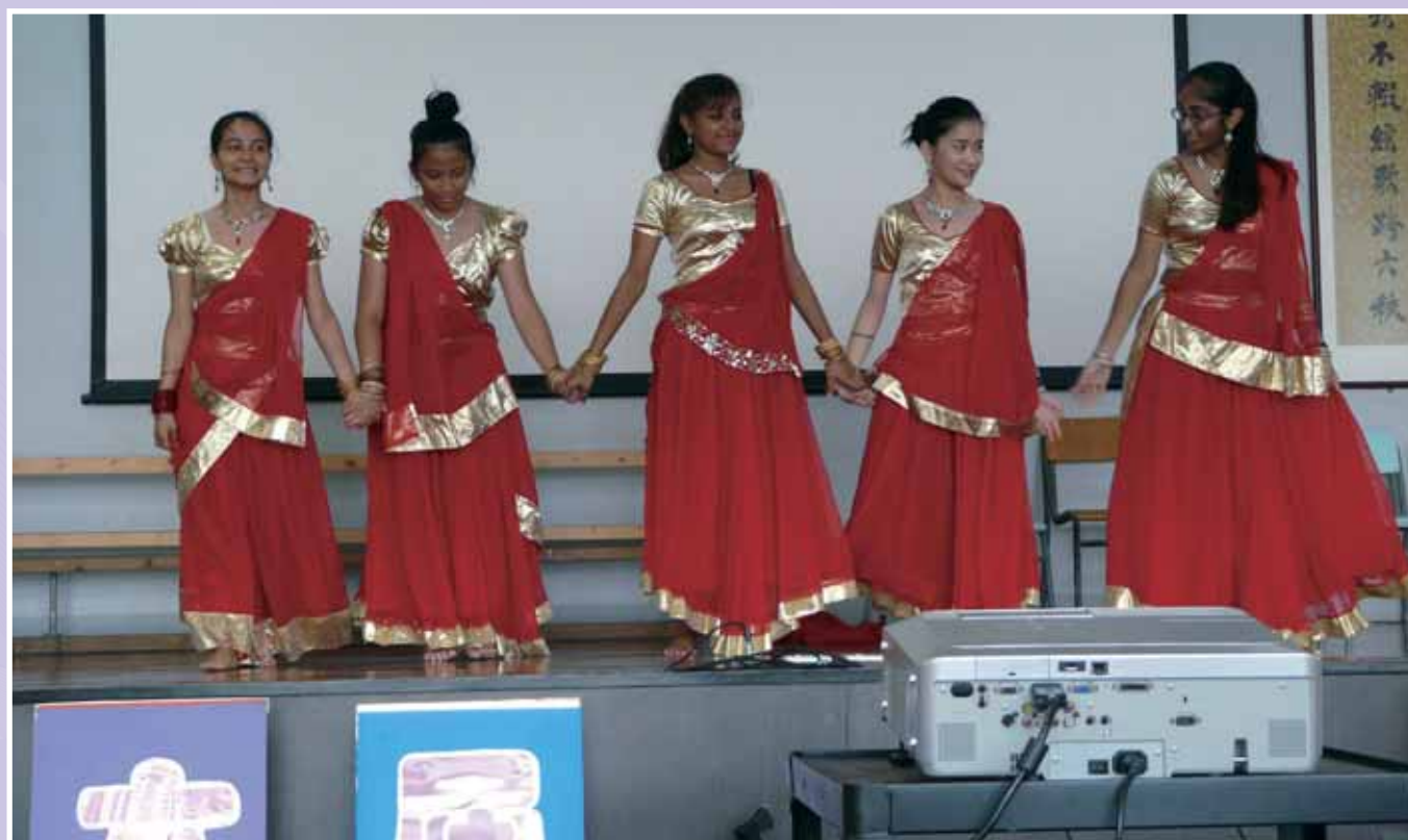
• 文化共融——地利亞書院(協和分校)精彩舞姿。