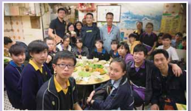
• 同學於北河燒臘飯店與明哥合照。

是次活動結合了通識、中文寫作、攝影及社區服務等不同的元素。在培養同學關懷別人的同時，亦讓他們掌握香港露宿者社群的現況；同學們更每人配備一部照相機，運用鏡頭拍下香港繁榮背後的一面。部分同學更將活動後的體會與思考，對弱勢社群的認識及感受，透過文字，或針砭時弊，或溫暖心靈，揭示露宿者的無奈，展現語文的魅力。本校更將同學們的作品結集成書，編成《歸宿何處》學生圖文集，凝聚感恩與關懷。