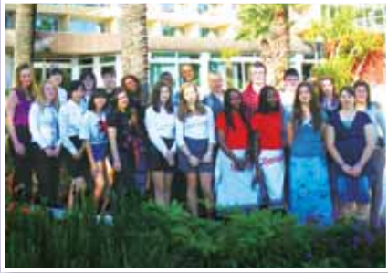
• 各國學生代表在交流期間合照。