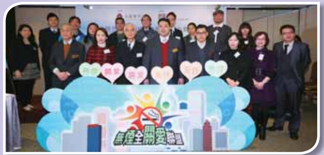
• 由不同戒別人士組成的無煙全關愛聯盟正式成立。

計劃更於 2014 年 2 月 17 日成立「無煙全關愛聯盟」，透過集結專業人士、商界、慈善團體、戒煙者及吸煙者家屬的力量，以關愛態度推動無煙香港。