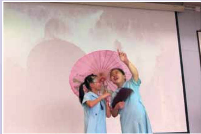
• 揉合多元素之新詩演繹，極富水準。

薈萃日分為兩個部分，無論第一部分的表演環節或第二部分的攤位/藝術工作坊環節，其宗旨是希望老師能帶領學生，配合過去一年各學習領域，透過學期底的學習畢業禮，把成果展現。