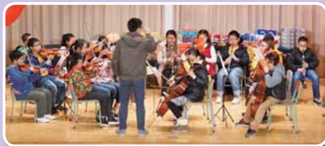
• 管弦樂團首次參與校內聖誕聯歡會的演出。

為了提供多元化的藝術活動並營造校園藝術氣氛，樂善堂梁鈺琚學校（分校）本年度成立了管弦樂團，讓學生透過學習樂器，培養對音樂的愛好。