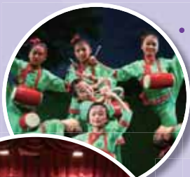
• 中國舞的演出功架十足！

學校安排了多元化的學習機會（共二十八項長期課外活動組別），栽培每一位學生於學術、體育、藝術、服務或其他領域，找到自己的強項，以建立自信。我們鼓勵學生參加不同的表演及比賽，令他們獲得外界認同，很多學生因此而改變，變得更積極學習，成績也有進步。