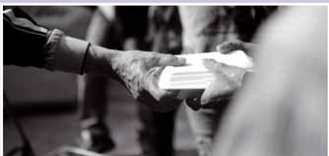
• 5C 唐永鴻同學攝。

參與活動的同學，走進深水埗區的橫街陋巷，抱着戰戰兢兢的心情探訪一群被社會遺忘的露宿者，和他們傾談，並進行一場足球友誼賽。經過一夜的相處，同學們都異口齊聲表示對露宿者的辛酸及生活的困苦有更多的了解，並進一步反思社會貧、富之間的關係。透過這次探訪，提升了同學的同理心，讓人性光輝的一面在同學的心靈播下種子，在未來的人生裏，能夠主動向有需要的人伸出溫暖的手。