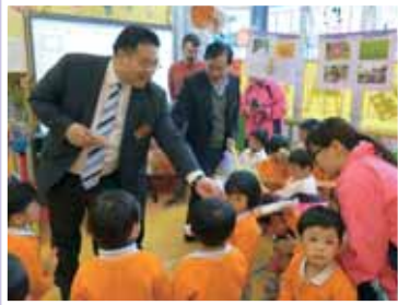
• 韓世灝主席巡視轄屬幼稚園時，派發小禮物予學生們。

本堂共有逾 30 個單位提供教育、醫療、社福及長者服務，常務總理會每年均會親臨各單位視察及了解運作情況，並藉巡視活動交流意見，改善現有的服務及發展新服務。