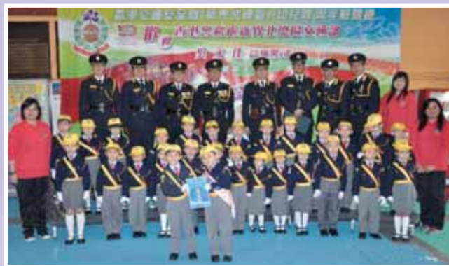
• 看我們交通安全隊獲得獎項！

此外為啟發幼兒不同的潛能或興趣，是年本校舉辦多項的興趣班，以提升幼兒的內在潛能（如：合唱團、交通安全隊、非洲鼓、網球班、珠心算、英語唱遊班等），讓學生發揮個人的所長。又為讓家長掌握教導幼兒英語的能力，亦加開週末親子英語班。