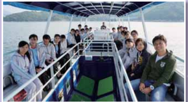
• 「海下灣考察」，加強學生對環境保育的意識。

本年度本校其他推行環保活動有：中三級環境保育領袖訓練、推行「減炭節能」計劃【四關政策】、推行「綠化天台」計劃【種植蕃茄仔工作坊】、參加「減廢回收在校園——塑膠再生變資源」計劃、「知慳惜電」節能比賽、墨盒回收計劃、四格減廢回收漫畫比賽（視藝科