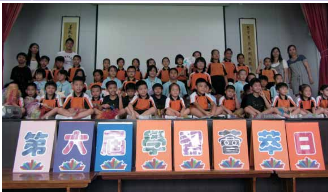
• 小一至三綜合藝術大匯演。