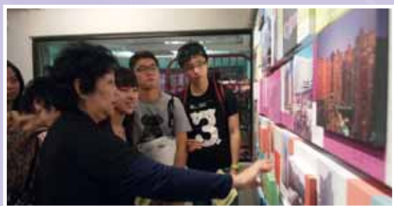
• 在參觀「美荷樓生活館」時，長者與青年分享舊日香港生活點滴。