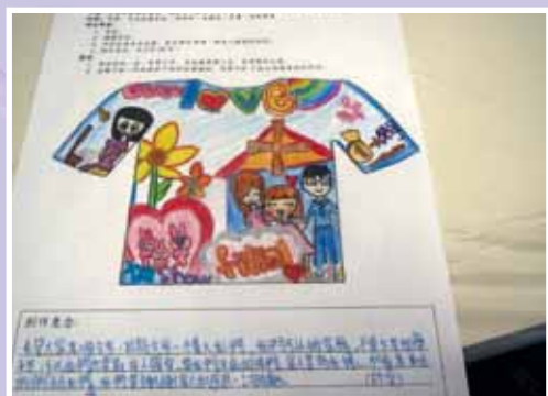
• 這麼有意義的活動，讓我寫下一點點感想吧！