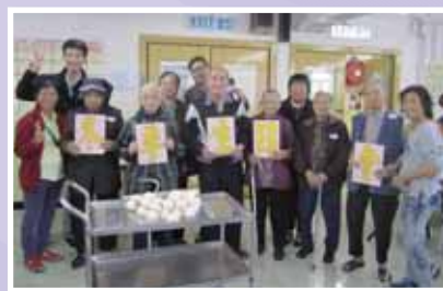
冬季生日會 (7/12/2013) 冬季生日院友代表與義工、職員大合照。