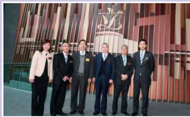
• 本堂同寅到訪立法會。