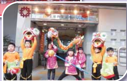
• 幼兒們落力投入演出。