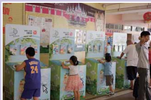
• 本校的開放日吸引了數百位區內人士到校，場面熱鬧。