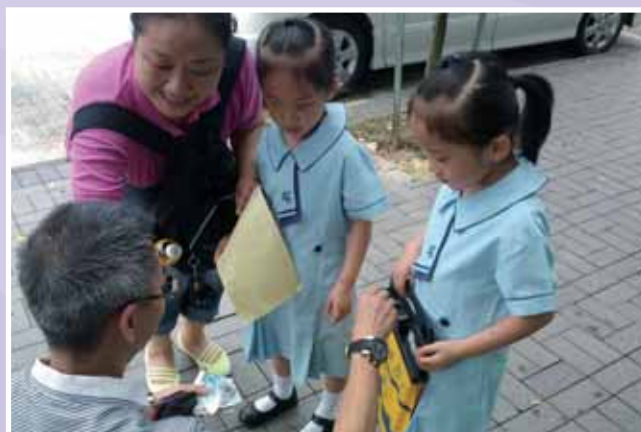
• 親子義工隊為本堂出一分力。

逾五千名義工參與「九龍樂善堂 -7.17 全港售旗日」，在眾志成城的努力下，共籌得逾一百六十萬元的善款，支持本堂之教育、醫療、安老及社會福利服務。