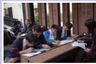
• 電子學習：中山史跡徑考察活動。

為豐富學習內容和增加學習的便利性，學校現正推行電子學習計劃，並申請教育局「電子學習學校支援計劃」，以提升全校無線網絡裝置，讓學生可以透過電子流動裝置進行全方位學習。除此之外，本校更參與