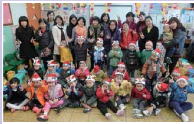
• 爸爸媽媽齊來學習 Kimochis 情智教育並與幼兒拍張大合照！

為了加強家校合作，增強對學校的歸屬感。本園持開放式的態度，舉辦不同類型的活動，讓家長參與，於聖誕聯歡會中，邀請家長到校與學生參與 Kimochis 情智教育活動及聚餐，讓校園及家中增添節日的氣氛，讓老師與家長及小朋友一同感受融洽、和諧的校園的氣氛。