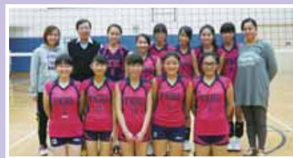
• 本校榮獲香港學界體育聯會(沙西分區)校際排球比賽女子甲一組冠軍。

學習方面重視兩文三語及資訊科技能力的發展，又依教育局語言政策，專業教師團隊於英文班及非英文班分別有各類教學策略及活動設計，讓不同水平學生提升學習能力及水平，達拔尖補底之效，以應付校內及公開考試。