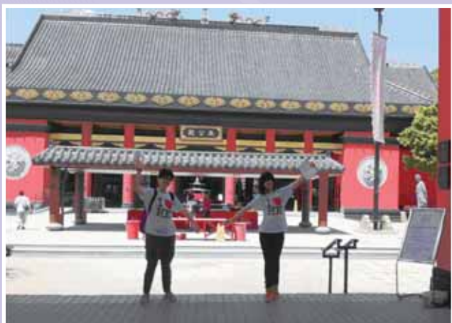
• 考察車公廟 (2)。