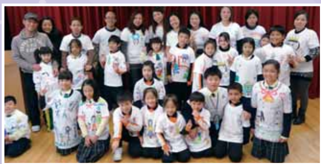
• 各家庭的暖暖親情 T 恤製作已完成了！