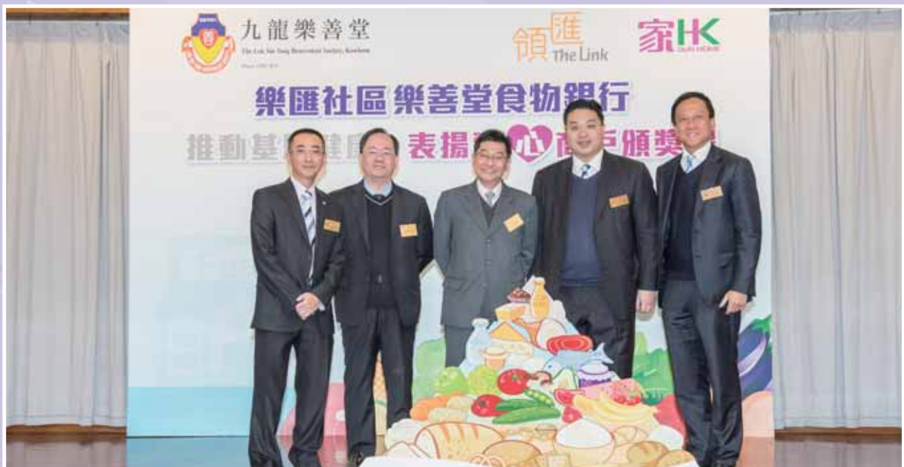
• 本堂於 2014 年 1 月 16 日舉行「推動基層健康•表揚愛心商戶頒獎禮」，社會福利署馮民重助理署長親臨主禮，嘉許參與計劃的愛心商戶。

樂善堂一直本著「關懷情真、樂善同行」的精神服務大眾，推出符合社會需要、照顧弱勢社群的服務。在此，本人特別感謝各政府部門、贊助機構、常務總理會各成員以及同寅的支持。在未來，我們定必繼續與時並進，為廣大市民提供更多適切的服務。