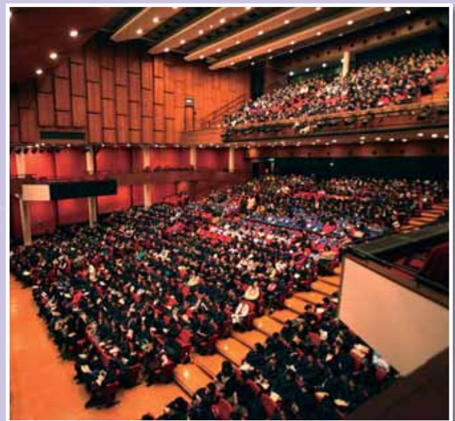
• 同學們靜心期待香港小交響樂團的演出。

通過布列頓《青少年管弦樂隊指南》，孩子們聆聽樂師們出色的演繹，遊走於雄壯的樂曲中，領略木管、銅管、弦樂及敲擊樂的不同特色，體驗交響樂團變化萬千的色彩世界。樂聚一小時轉瞬便過去，只留給每個觀眾裊裊餘音。有出席的學生表示，交響樂開拓了他的眼界，是難能可貴的體驗。