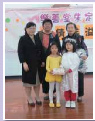
• 聖保祿幼兒園學表演歌舞。