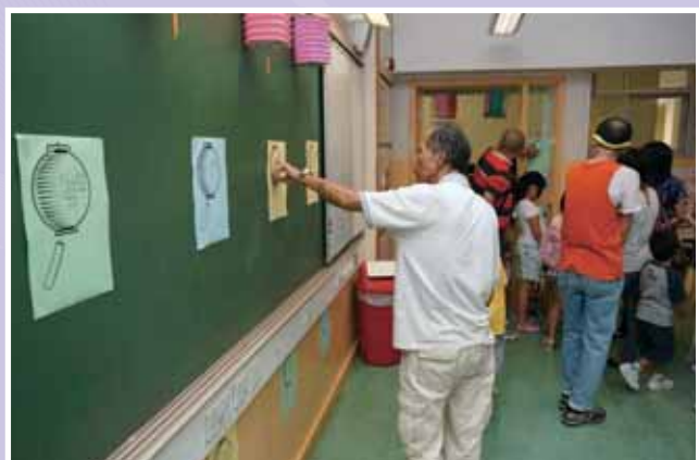
• 本校的開放日吸引了數百位區內人士到校，場面熱鬧。