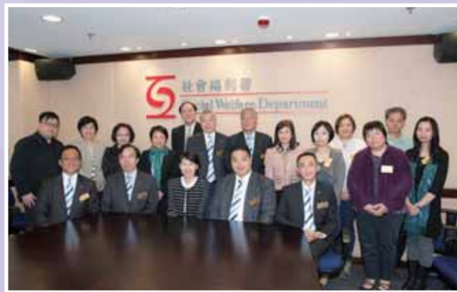
• 本堂常務總理到社會福利署拜會及交流。