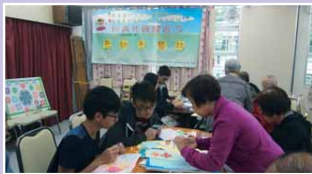
• 長者教授青少年剪紙技巧。

在活動過程中，長者將寶貴的人生經驗與青年人分享，讓青少年學習上一代如何面對逆境及自處，建立正向人生觀。其次，長者義工除協助推行有關活動外，更參與活動策劃，實踐「老有所為」的精神；另一方面，青年義工除增加對香港歷史的了解外，亦從上一代香港人身上，領悟到「知足常樂」及「逆境自強」的道理，更重要是提供了讓兩代義工溝通和合作的機會，造就日後合作的基礎。