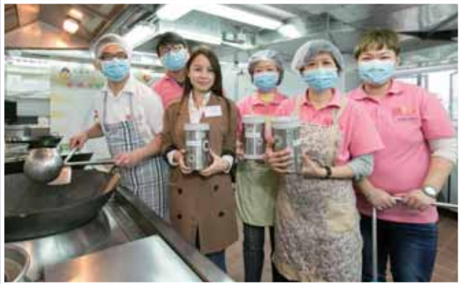
• 樂『膳』堂營養膳食服務中心員工為長者送上營養愛心膳食。