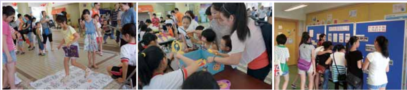
• 本校的開放日吸引了數百位區內人士到校，場面熱鬧。

等等。由於當天臨近中秋節，當中亦加插了中秋節攤位活動，共吸引了區內數百位家長到場參觀，場面熱鬧。