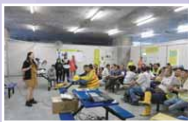
• 計劃團隊到吸煙者工作地點進行煙害講座。

本堂獲衛生署控煙辦公室資助，與香港大學護理學院、公共衛生學院以及心理學系合作，開辦為期兩年的「愛•無煙 — 前線企業員工戒煙計劃」。由企業及僱主著手，由上而下推動員工戒煙。計劃團隊（包括社工及醫護人員）以外展形式到吸煙者工作的地方進行煙害健康講座及簡單身體檢查，藉此招募吸煙者參與戒煙計劃。計劃目標兩年招募 60 間機構參加，但由於反應熱烈，首年已招募了超過 100 間機構，當中包括各大中小企業及不同的行業。