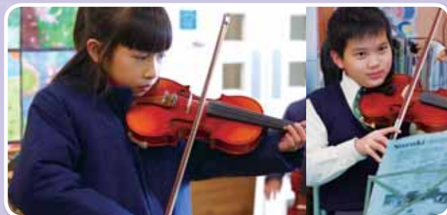
• 同學們專注地練習。