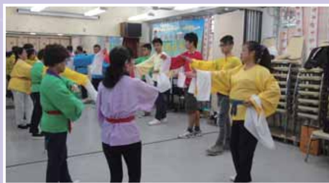
• 長者與青年一同學習粵劇造手技巧。