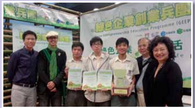
● 本校三位中六級同學於「綠色企業創業兵團」比賽中勇奪「全場最受歡迎綠色企業」獎項。

另一方面，本校亦於本年度組織青年氣候大使隊伍，參加由聯合國環境規劃署 (UNEP) 主辦的全港首個學界氣候網絡活動「青年氣候聯盟」，結果本校除了獲得$6000資助，籌辦一連串低碳活動外，亦入選為最後10支表現出色的隊伍。因此，我們的同學更進行了一連串的小學學校巡迴演講，分享環保推廣活動中的點滴。