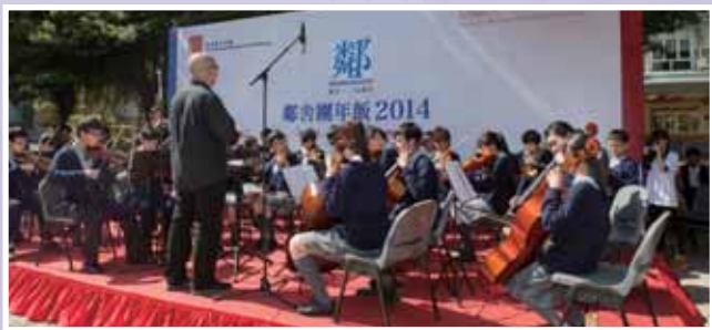
• 管弦樂團於鄰舍團年飯演奏賀年音樂。

在創意藝術方面，由校園電視台學生創作，以青少年成長為主題的微電影《童心飛揚 Our Heart Forever Sing》，參加了香港中華基督教青年會及智權教育中心合辦的「首屆全港中學微電影創作大賽」，奪得高中組冠軍、最佳導演及最佳攝影三個獎項，充分肯定創作團隊的創意及努力。