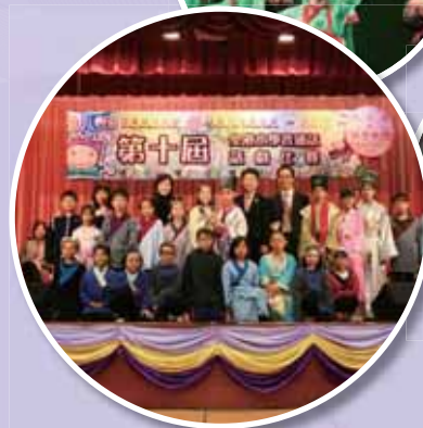
• 話劇組同學於全港小學普通話話劇比賽中奪得金獎。