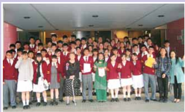
• 「新加坡英語領袖考察計劃」銳意培訓英語大使。

校園電視台舉辦「港台兩地電影創作與文化體驗之旅」，帶領學生前往台灣高雄參加「第九屆台灣金甘蔗影展」比賽活動，本校學生為大會最年輕參賽者，並自擬定主題，編寫劇本，在當地攝製作品，經驗實屬難能可貴，獲益良多。