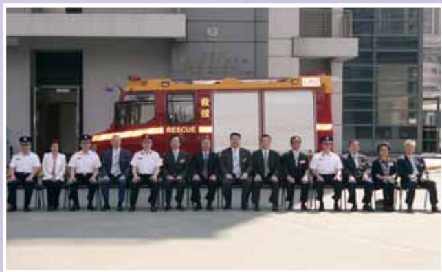
• 本堂常務總理參觀消防處西九龍救援訓練中心。