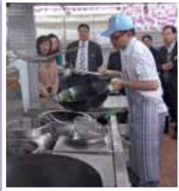
• 總理們參觀「膳」堂營養膳食服務中心。