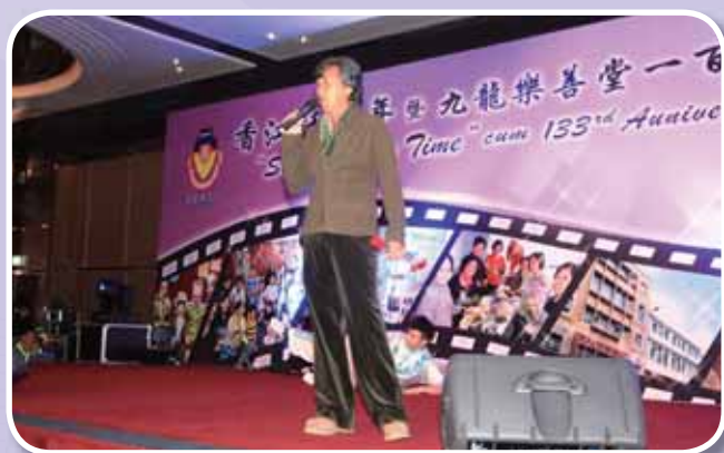
● 殿堂級歌手林子祥打頭陣獻唱多首經典金曲，配合香江話當年的主題，為晚宴掀起高潮。