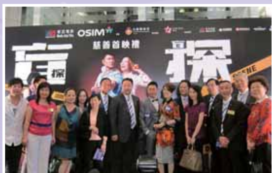
• 男女主角劉德華及鄭秀文出席首映禮。

樂善堂舉辦的《盲探》慈善首映，由現時香港最炙手可熱的銀幕情侶 - 劉德華及鄭秀文主演。是次慈善首映吸引數百名總理及善長支持，門票收益扣除成本後，共籌得逾五十萬元，以支持本堂之「樂善童心 - 協助特殊學習需要兒童計劃」，幫助有特殊學習需要的基層兒童接受低廉而專業的評估及訓練。