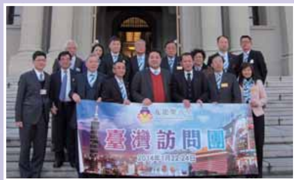
● 一眾常務總理到訪中華民國總統府。

常務總理會再次到訪臺灣，拜會中華民國吳敦義副總統、行政院大陸委員會、臺北市政府及臺北慈濟醫院，交流港臺兩地的社會服務及慈善事業發展。