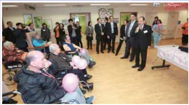
• 勞工及福利局局長張建宗 GBS 太平紳士為大角嘴海泓道護養院進行揭幕禮，並與一眾長者同樂。

除了院舍服務外，樂善堂最近亦在民政事務總署「伙伴倡自強社區協作計劃」資助下，開辦了樂「膳」堂營養膳食服務中心，為九龍城及黃大仙區內長者提供送飯服務。本中心的宗旨是為長者、剛離院、復康及其他有需要人士提供價廉而優質的營養膳食服務，減輕其家人所承受的壓力；並為區內低技術的青年人及中年人士提供就業及培訓機會，聘請他們在本膳食服務中心工作。我們希望以樂善堂各類社區支援、院舍、醫療服務，使長者能享受尊嚴並愉快的生活，安享晚年。中心已於 2014 年 1 月中旬正式投入服務，目前正服務 80 名長者，