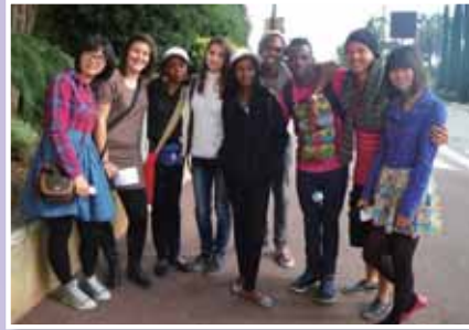
• 與匈牙利、牙買加、南非、巴西學生代表合照。