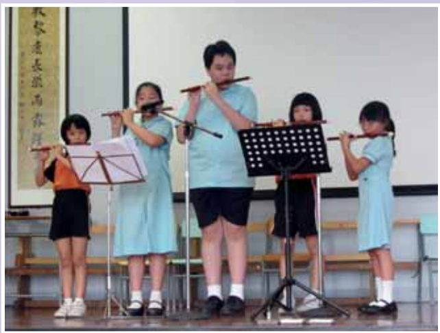
• 關愛基金課後笛子班——「世界真細小」。

當周校長、教師代表、家長代表、校友代表、四社學生代表主持開幕後，第一部分的表演項目立刻開始。表演項目包括「我是至叻」(SING)、「MY LOVE : STORY-TELLING」、歌曲〈在森林和原野〉、戲劇「捉賊記」、See me dance、「舞」出真我、康文署「能說善導戲劇計劃」——「誰是好老師」、舞蹈表演跆拳道表演、新詩集誦——香港是我家、揉合多項藝術元素的集誦——「神州大地」、武術表演、夏威夷結他表演、笛子表演——「世界真細小」、綜合藝術表演、牧童笛演奏、小提琴演奏(童話)、電子琴演奏(良師頌)、鋼琴演奏等。樂校一直致力推廣文化共融，當日更邀請了地利亞書院(協和分校)的一群南亞裔中學生載歌載舞。