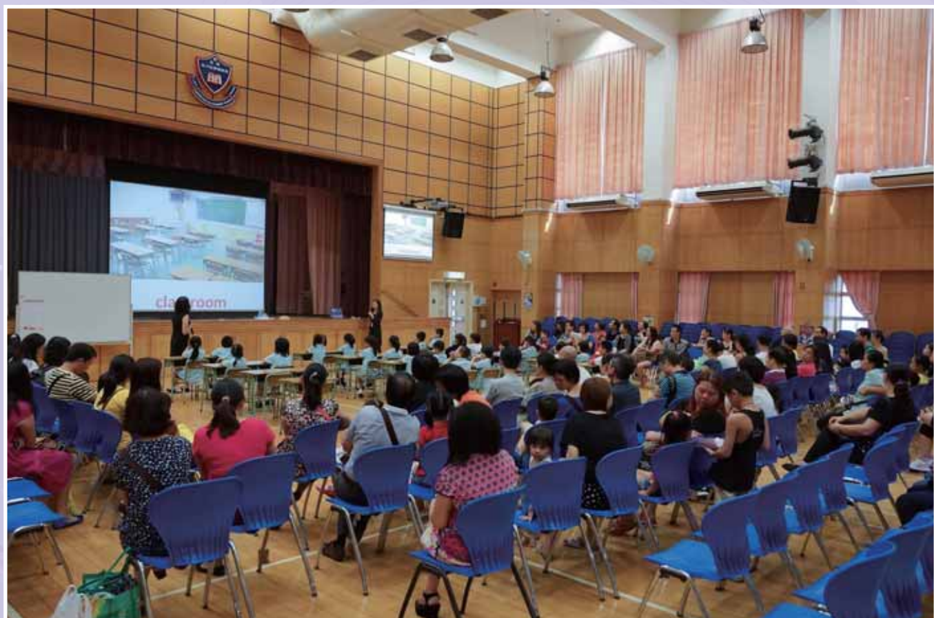
• 舉行英文公開課，讓區內家長了解本校老師如何設計有趣的課堂。