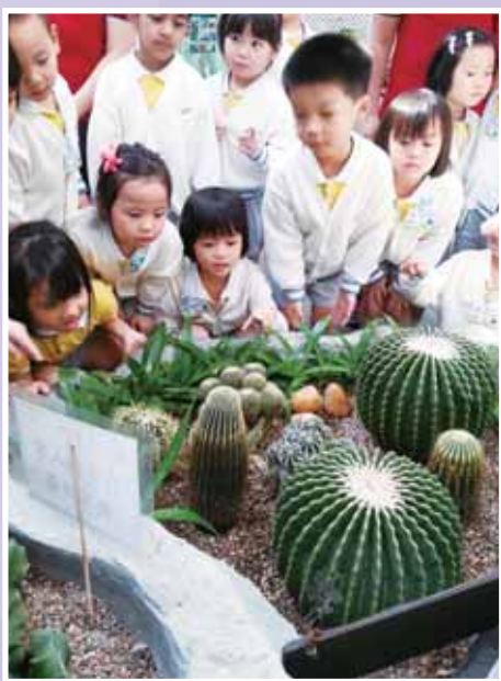
• 參觀綠化資源中心。

本園重視全人發展，培育兒童身心健康成長；營造愉快學習環境，讓兒童樂於學習，培養良好的學習態度和生活習慣；學校更會透過 Kimochis 情緒社交系統課程，讓兒童認識及管理情緒，使他們在待人接物及情智發展方面取得效果，並學會關心他人、與他人建立良好關係、為自己作決定、積極面對困難。此外，為促進兒童及其家庭的和諧健康，讓校園建立關愛輔導系統，本校與循道衛理觀塘社會服務處合作，推行「陽光幼苗」幼稚園全方位支援服務，為兒童及其家庭提供一系列服務，包括駐校社工服務、學童成長服務、親子培育活動，以強化家長的角色及功能，提升家長在其子女培育方面的質素，並促進兒童正面及健康的心理發展。