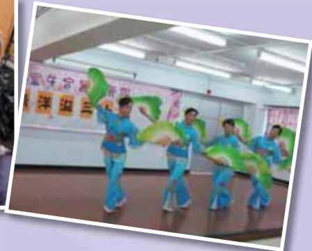
* 台上台下開心滿載 *