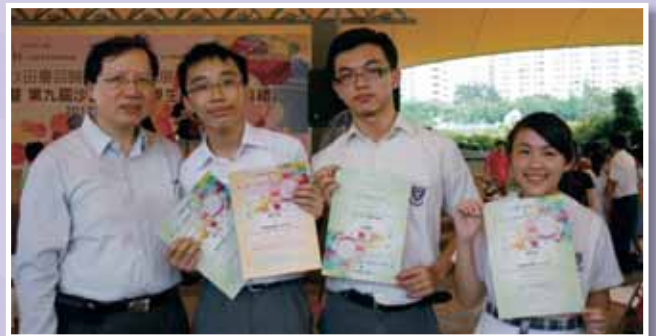
● 第九屆沙田區傑出學生選舉，本校4位中三及中五同學分別獲得傑出學生優勝獎、戰略競賽個人卓越表現獎及優異學生證書。