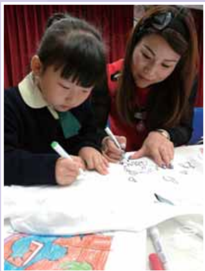
• 樂善堂轄屬小學啟藝活動——「暖暖親情 T 恤製作活動」。

本校視藝科與家教會合作舉行了「暖暖親情 T 恤製作活動」，此乃樂善堂轄屬小學啟藝計劃其中一個項目，目的是透過親子設計及 T 恤製作，加強親子關係，培養愛是無私付出、偉大真摯的精神，讓暖暖溫情照遍人間的。12 月 17 日約 40 人（家長、四至六學生）於小禮堂參與「T 恤製作工作坊」，家長與學生一起合作在 T 恤上設計及繪畫精美的圖案，場面十分溫馨。比賽中 6 人獲選出冠、亞、季軍及優異獎，獲頒發獎狀以示鼓勵。在 12 月 19 日「四社親子聖誕歌唱比賽」中，各家長及學生穿上自己設計的 T 恤進行大合唱，匯演「世上只有」，令聖誕聯歡活動增添了不少氣氛。