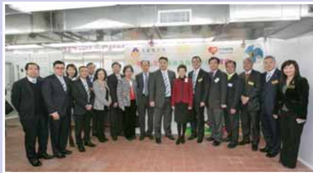
• 樂「膳」堂營養膳食服務中心揭幕禮邀請到民政事務總署署長陳甘美華太平紳士擔任主禮嘉賓，見證中心服務正式開展。