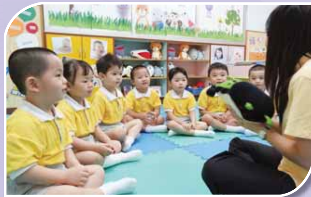
• 幼兒非常投入課堂。

透過「溢出幼苗」幼稚園駐校社工計劃，讓社工進入課室觀察學生，並設立「情緒小主人」、「專心至叻星」學生小組，透過遊戲及故事形式，促進幼兒如何正確地處理情緒或提升專注力等，以改善兒童學習。在完成輔導工作後，社工與個案老師和家長傾談有關學生情況。另開設「家長鬆一鬆」活動，藉此與家長分享育兒小錦囊、教授減壓操等等，讓家長有一個輕鬆的時間減壓。