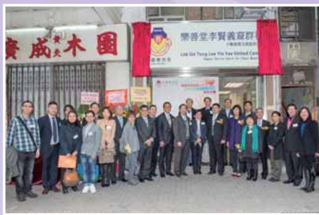
• 一眾常務總理及嘉賓出席「樂善堂李賢義裔群社 - 少數族裔支援服務中心」揭幕禮，場面熱鬧。

關注人口老化問題，本堂近年致力發展及改善長者服務。本堂成功投得社署位於旺角海泓道的護養安老院舍，並在今年 1 月投入服務，以照顧中度至嚴重需要特別護理之長者為主。為配合腦退化症患者，院舍亦特別設有懷舊閣、感官治療室等設施。