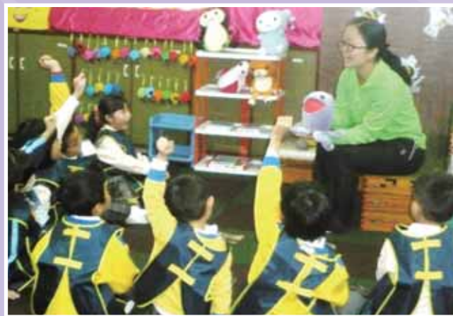
• 幼兒非常投入 Kimochis 情智教育的活動中。

本園透過教育的過程，幫助幼兒抒發情緒，啟發自我潛能，故是年參加了「啟發潛能教育」(Invitational Education) 計劃；透過地方 (Places)、政策 (Policies)、計劃 (Programs)、流程 (Processes)、人物 (People) 的五個範疇 (5P) 同時運作，互相配合，能讓幼兒愉快地學習；我們落實該理論所強調的尊重 (Respect)、信任 (Trust)、樂觀 (Optimism)、關懷 (Care) 及刻意安排 (Intentionality) 等重點，為學生營造一個充滿支持、讚賞、笑臉、鼓勵的校園。本園並推行 Kimochis 情智教育課程，透過不同情緒角色布偶，配合不同情景學習，培養幼兒正面的溝通習慣來處理生命中可能遇上的社交情緒障礙和挑戰；能有效及適合地讓他人知曉自己的情緒，建立社交情智的自信，讓幼兒能感受自我價值及有效地鞏固人際關係。