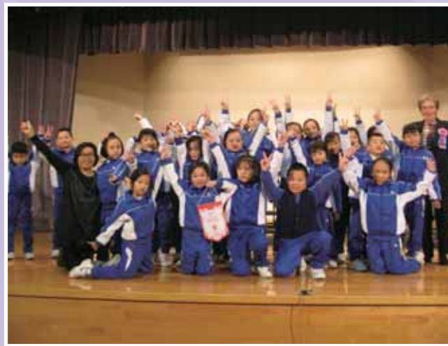
• 第 65 屆校際朗誦節造型朗誦比賽獲得冠軍。