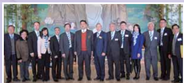
● 本堂同寅參觀臺北慈濟醫院。