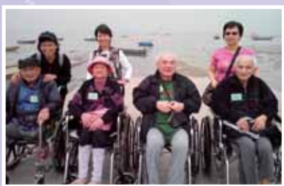
豪玩蠔食流浮山 (27/11/2013) 院友與親友、義工一起觀看晒金蠔的情況。